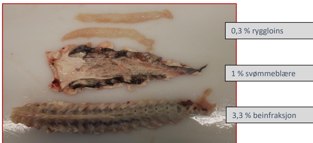
Bilde 1 – utbyttet av hodekappet torsk; ryggloins, svømmeblære og beinfraksjon.

Salt- og klippfiskindustrien har et stort volum rygger som har et potensiale for å utnyttes til human anvendelse. Ved hjelp av maskiner fra den islandske utstysprodusenten MESA er målsetningen å avklare om tilgjengelig teknologi for maskinell fraksjonering av klippfiskrygger til loins, farse, bein og svømmeblærer kan øke utnyttelsen av restråstoff og verdipotensialet i norsk salt- og klippfiskindustri.